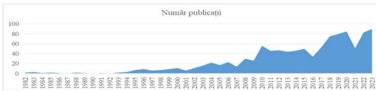
Figura nr. 1. Numărul de publicații

Schimbările succesive din cadrul articolelor de cercetare științifice pot dezvălui aspecte esențiale cu privire la interesul acordat unui anumit domeniu, în cazul de față fiind vorba despre evoluția cronologică a abordărilor privind fraudă. Figura nr.1 prezintă un număr de 1.072 articole publicate între anii de referință ai studiului, 1982 – 2023, indicând o creștere constantă, aspect care consolidează ideea de cercetare și importanța a acestora în domeniul economico-financiar.